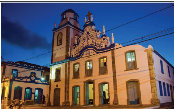
Igreja de Santo Antônio