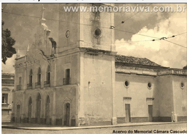
Igreja de Santo Antônio