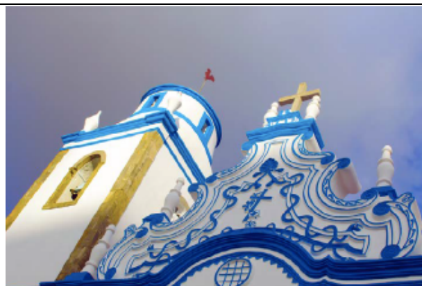
Detalhes do Frontispício