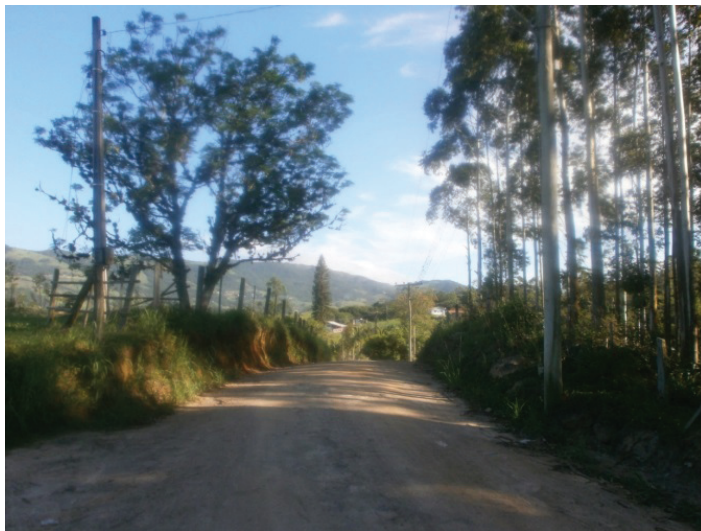
Figura 3 – Percorrendo a Toca de Santa Cruz