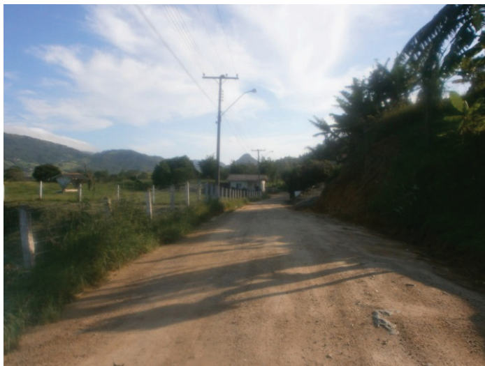
Figura 2 – Vista da entrada da comunidade Toca de Santa Cruz