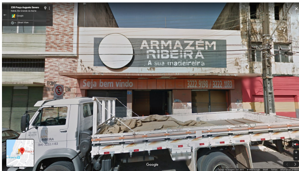
IMAGEM FRONTAL EDIFICAÇÃO PAS-252 (NOV. DE 2011)