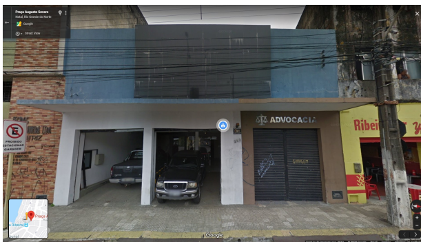
IMAGEM FRONTAL EDIFICAÇÃO PAS-252 (AGO. DE 2019)