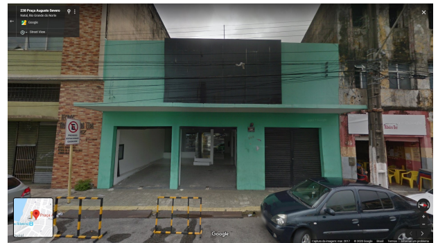
IMAGEM FRONTAL EDIFICAÇÃO PAS-252 (MAR. DE 2017)