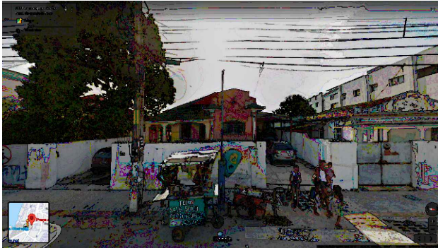
IMAGEM FRONTAL EDIFICAÇÃO PAS-288 (NOV. DE 2011)