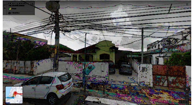
IMAGEM FRONTAL EDIFICAÇÃO PAS-288 (MAR. DE 2017)