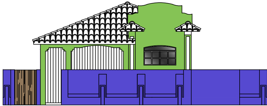
EDIFICAÇÃO PAS-288 - FACHADA FRONTAL