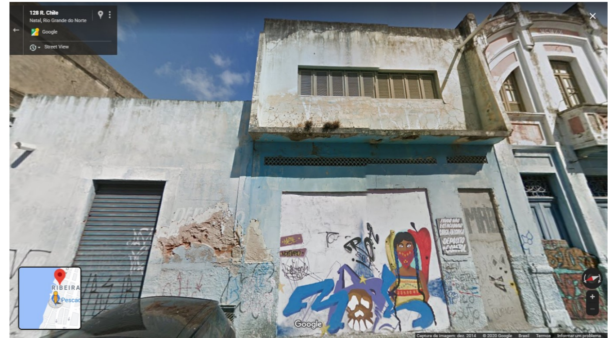
IMAGEM FRONTAL EDIFICAÇÃO RC- 125 (DEZ. DE 2014)