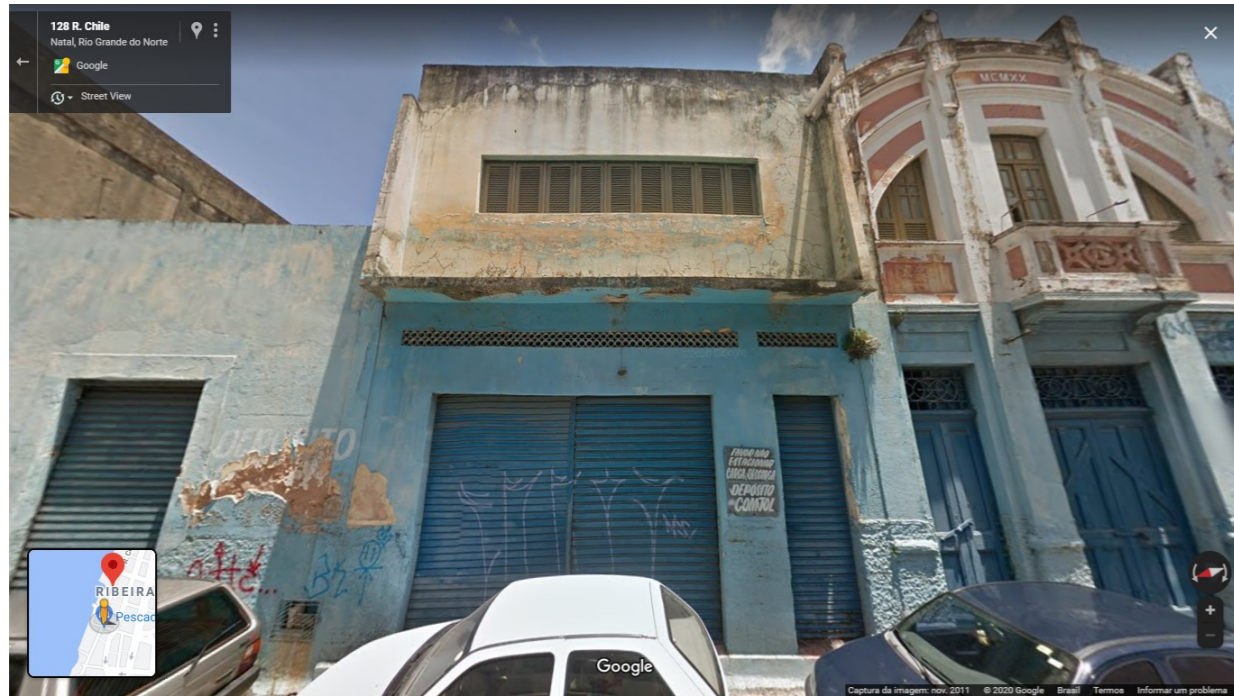
IMAGEM FRONTAL EDIFICAÇÃO RC- 125 (NOV. DE 2011)