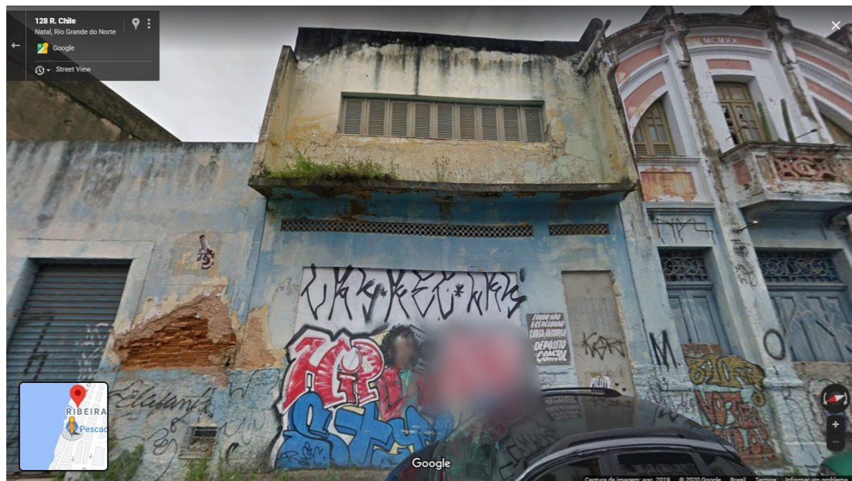
IMAGEM FRONTAL EDIFICAÇÃO RC- 125 (AGO. DE 2019)