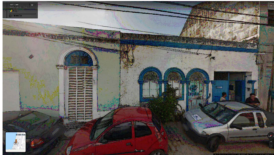
IMAGEM FRONTAL EDIFICAÇÃO RC-184 (NOV. DE 2011)