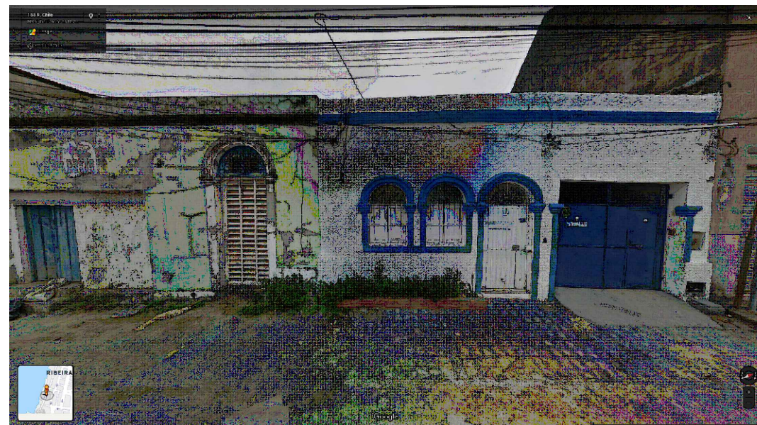
IMAGEM FRONTAL EDIFICAÇÃO RC-184 (AGO. DE 2019)