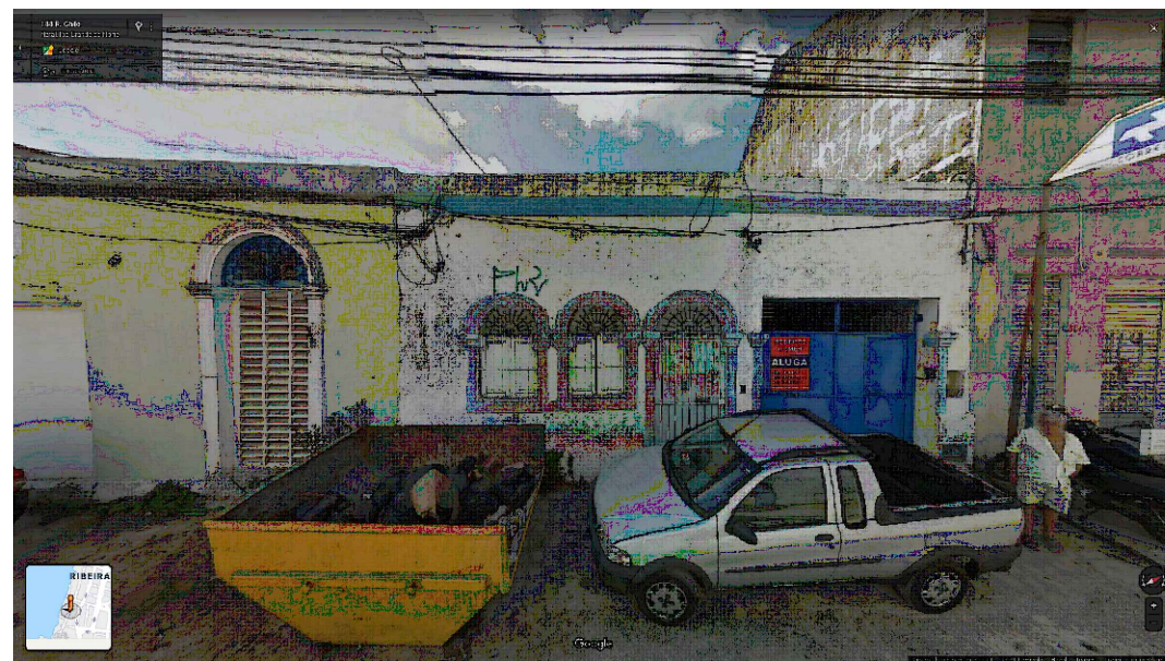
IMAGEM FRONTAL EDIFICAÇÃO RC-184 (AGO. DE 2014)