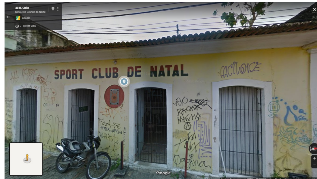
IMAGEM FRONTAL EDIFICAÇÃO RC- 14 (AGO. DE 2019)