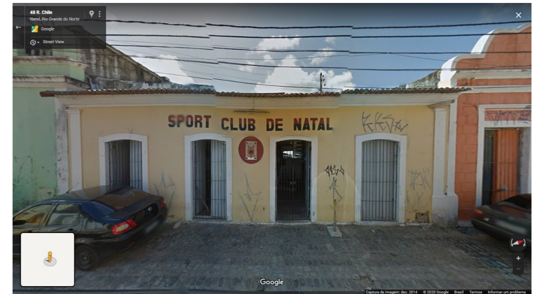
IMAGEM FRONTAL EDIFICAÇÃO RC- 14 (DEZ. DE 2014)