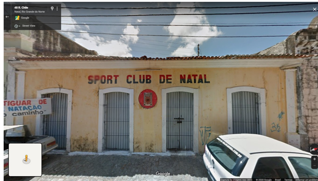
IMAGEM FRONTAL EDIFICAÇÃO RC- 14 (NOV. DE 2011)