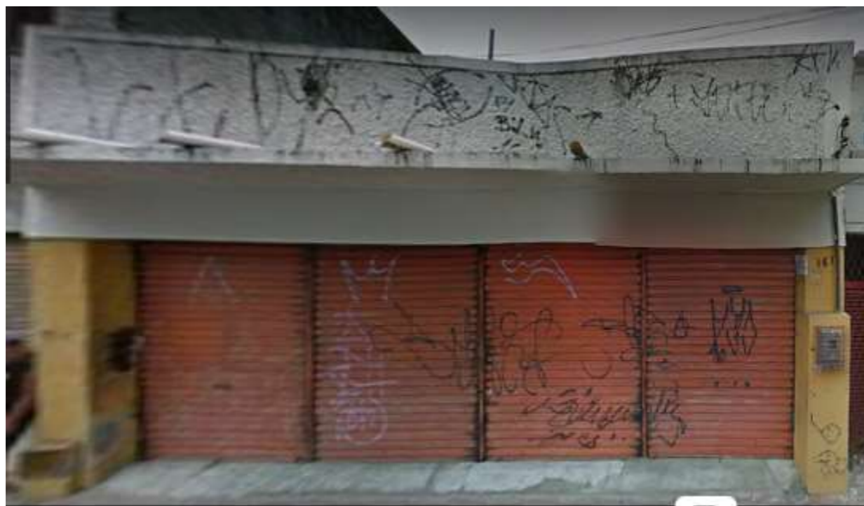
IMAGEM FRONTAL EDIFICAÇÃO RDB-161 (AGO. DE 2019)