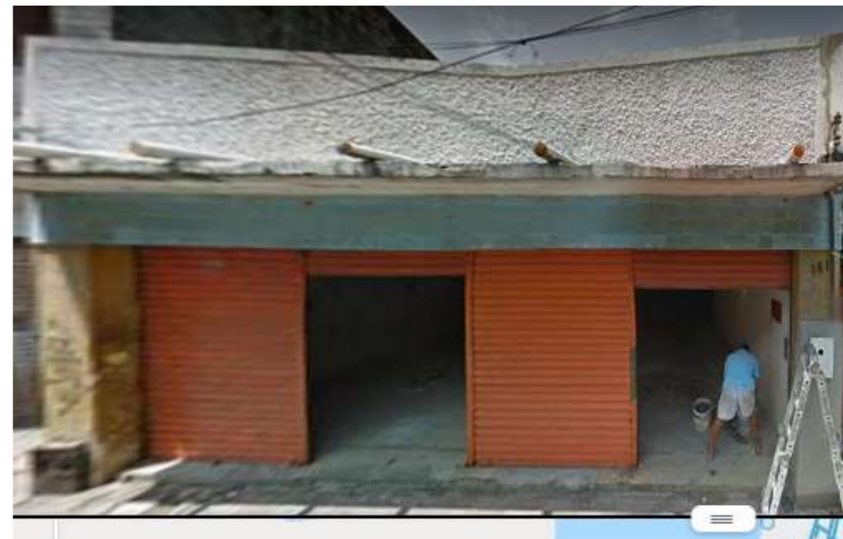
IMAGEM FRONTAL EDIFICAÇÃO RDB-161 (DEZ. DE 2014)