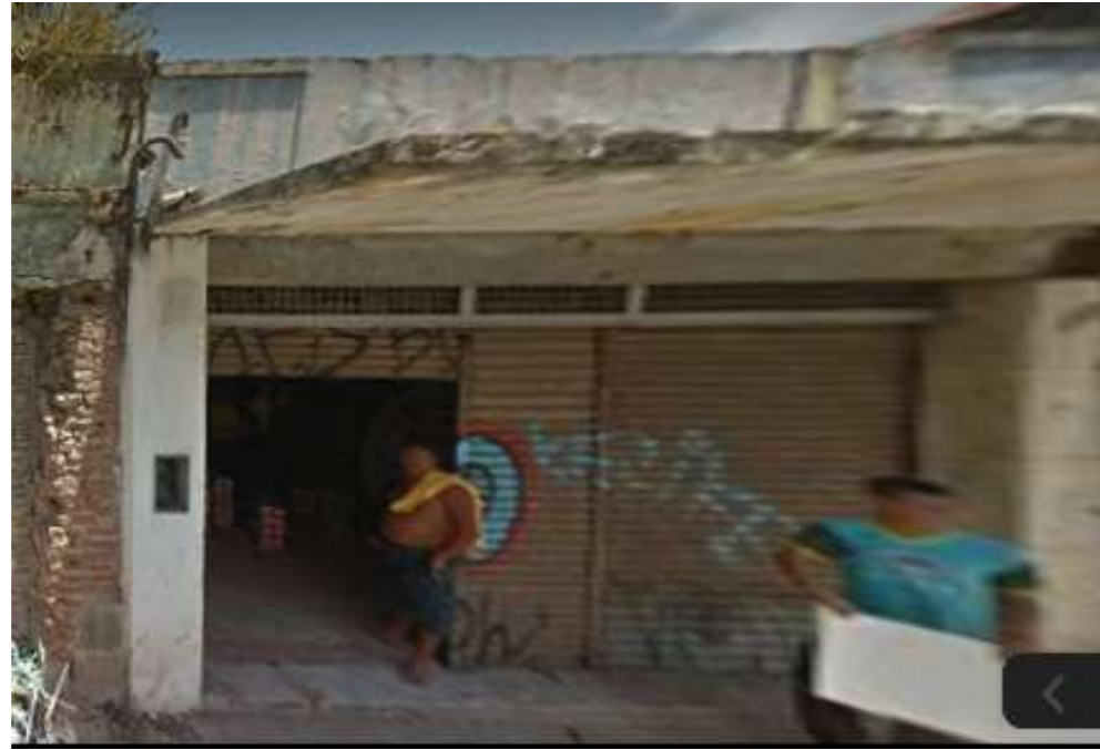
IMAGEM FRONTAL EDIFICAÇÃO RDB-177 (NOV. DE 2011)