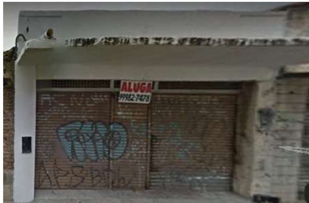
IMAGEM FRONTAL EDIFICAÇÃO RDB-177 (AGO. DE 2019)