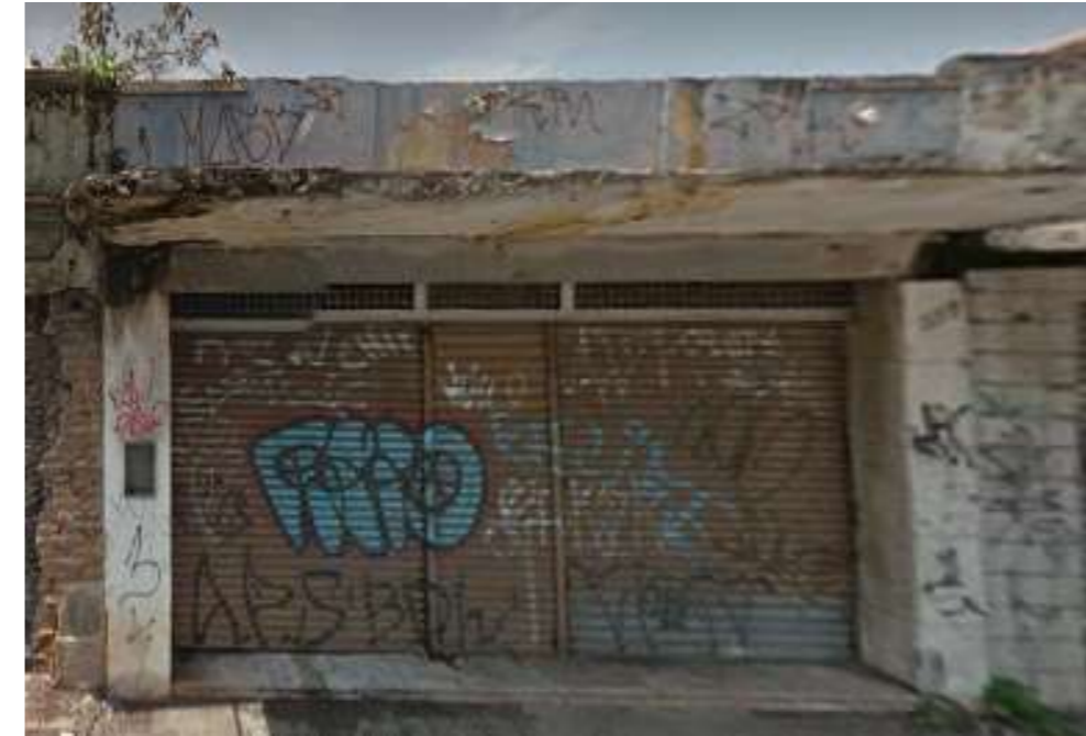
IMAGEM FRONTAL EDIFICAÇÃO RDB-177 (DEZ. DE 2014)