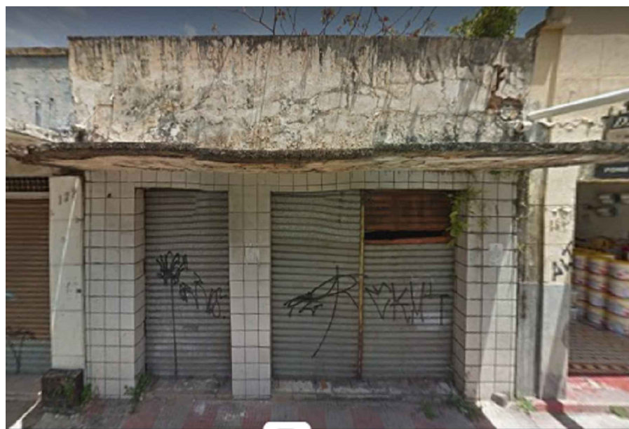
IMAGEM FRONTAL EDIFICAÇÃO RDB - S_N04 (NOV. DE 2011)