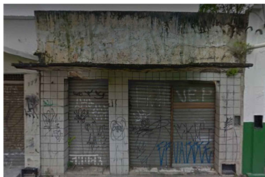
IMAGEM FRONTAL EDIFICAÇÃO RDB - S_N04 (AGO. DE 2019)

2 - PARA A EXECUÇÃO DE QUALQUER INTERVENÇÃO NA EDIFICAÇÃO EM QUESTÃO, É IMPRESCINDÍVEL A CONFERÊNCIA IN LOCO DAS MEDIDAS DA MESMA.