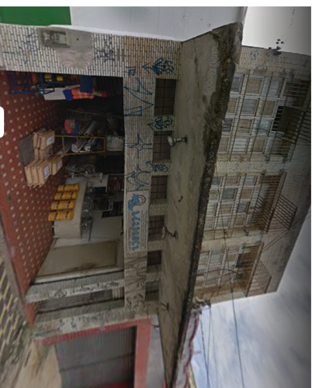
IMAGEM FRONTAL EDIFICAÇÃO RDB - 187 (AGO. DE 2019)