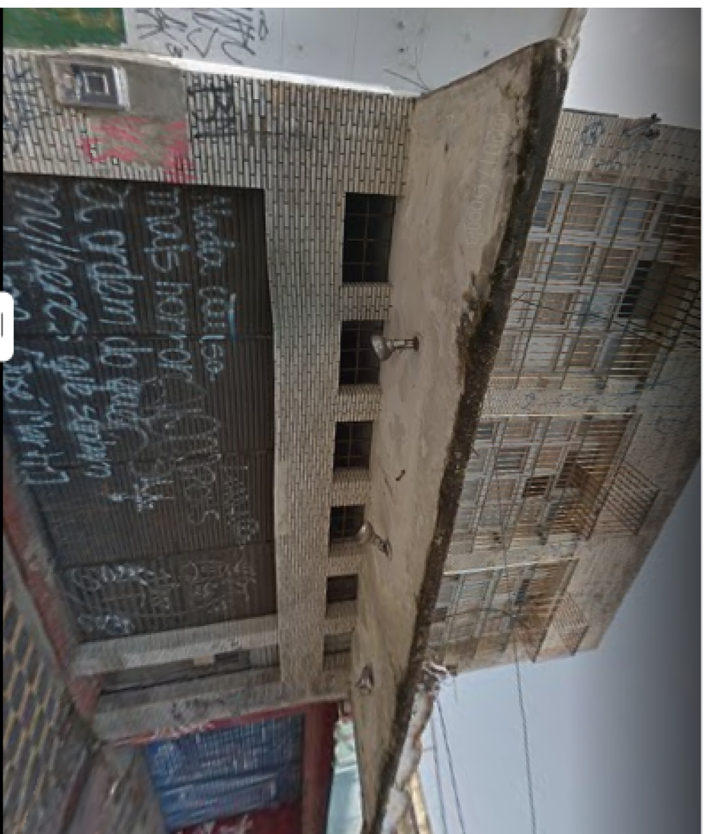
IMAGEM FRONTAL EDIFICAÇÃO RDB - 187 (AGO. DE 2015)