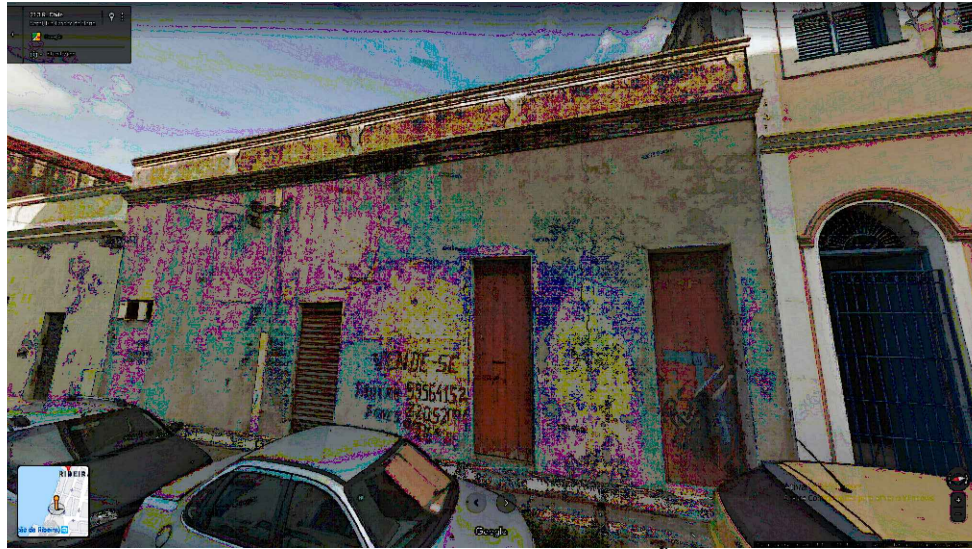
IMAGEM FRONTAL EDIFICAÇÃO RC-213 (NOV. DE 2011)