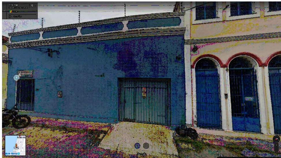
IMAGEM FRONTAL EDIFICAÇÃO RC-213 (AGO. DE 2019)