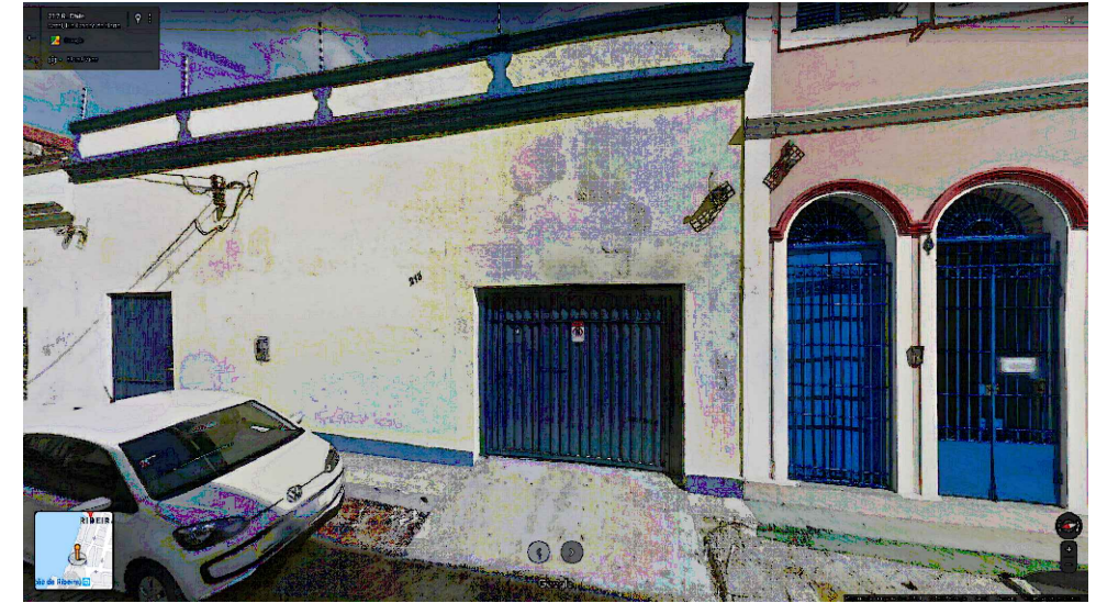
IMAGEM FRONTAL EDIFICAÇÃO RC-213 (AGO. DE 2014)