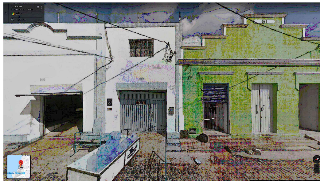
IMAGEM FRONTAL EDIFICAÇÃO RC-225 (AGO. DE 2014)