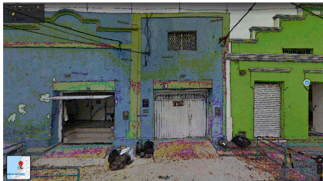
IMAGEM FRONTAL EDIFICAÇÃO RC-225 (AGO. DE 2019)