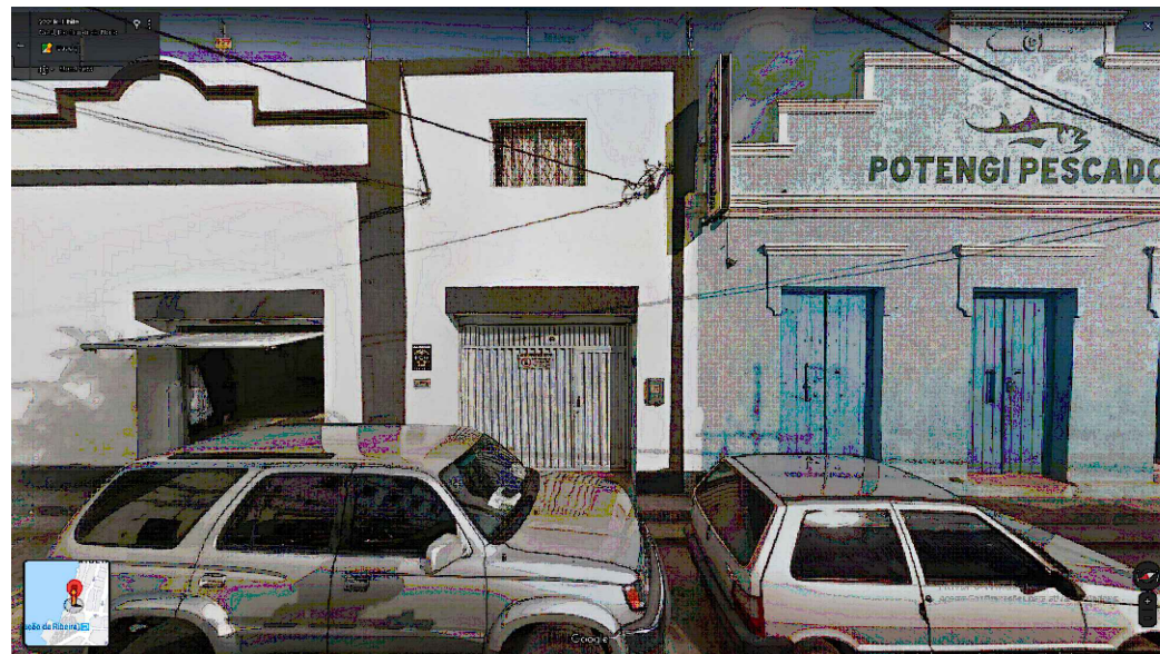
IMAGEM FRONTAL EDIFICAÇÃO RC-225 (NOV. DE 2011)