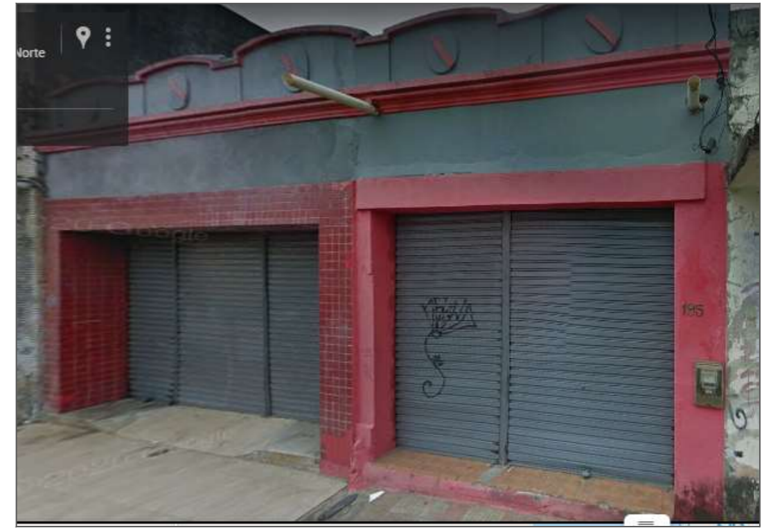
IMAGEM FRONTAL EDIFICAÇÃO RDB - 195 (AGO. DE 2019)