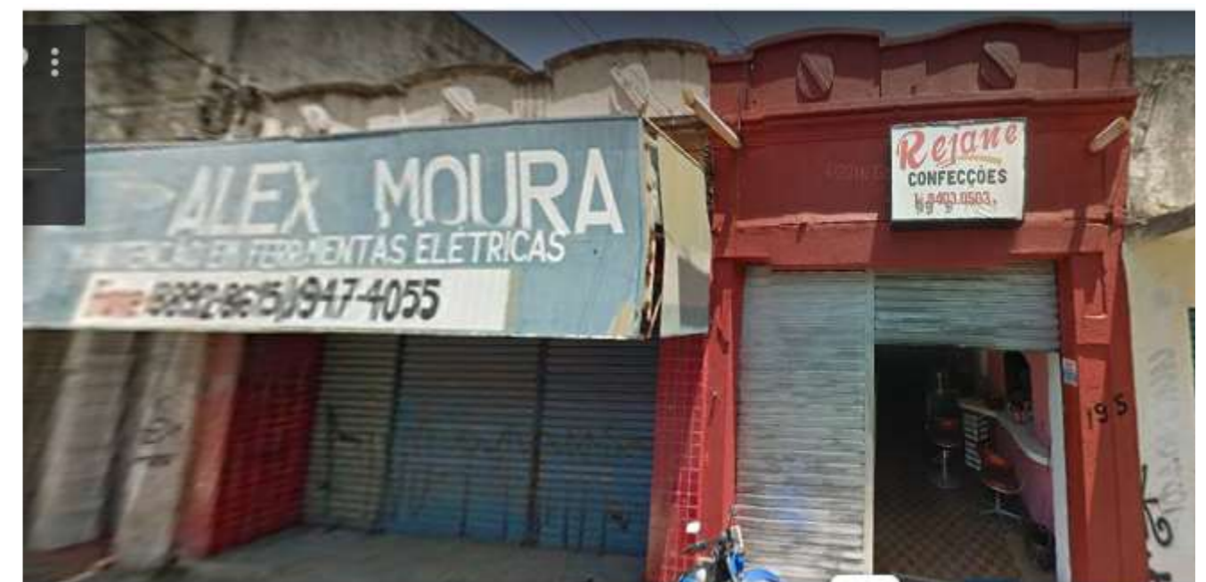
IMAGEM FRONTAL EDIFICAÇÃO RDB - S_N10 (NOV. DE 2011)