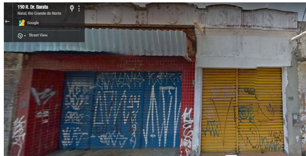
IMAGEM FRONTAL EDIFICAÇÃO RDB - 195 (AGO. DE 2015)