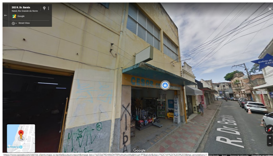
IMAGEM FRONTAL EDIFICAÇÃO RDB-209 (AGO. DE 2019)