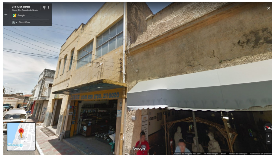
IMAGEM FRONTAL EDIFICAÇÃO RDB-209 (NOV. DE 2011)