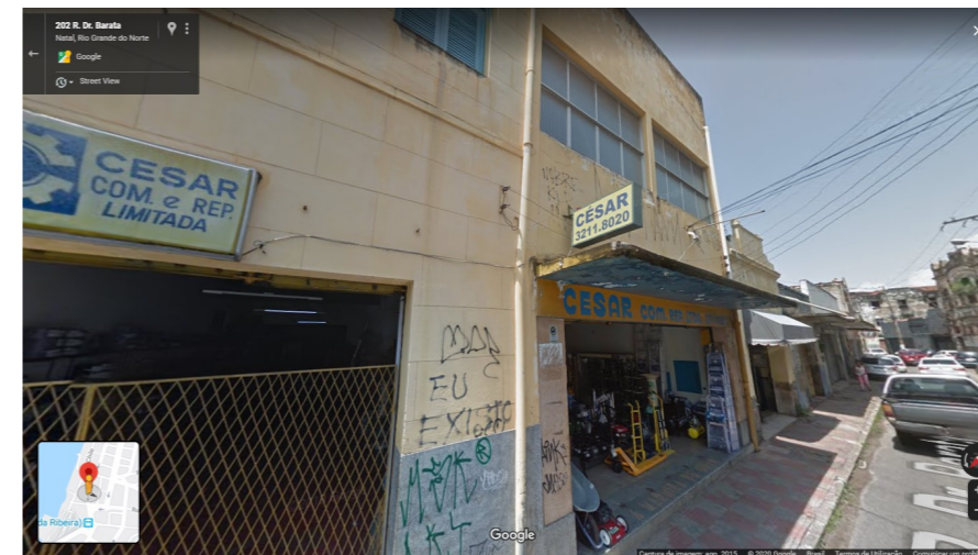
IMAGEM FRONTAL EDIFICAÇÃO RDB-209 (DEZ. DE 2014)