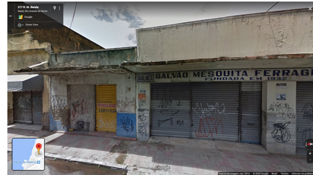
IMAGEM FRONTAL EDIFICAÇÃO RDB-213 (DEZ. DE 2014)