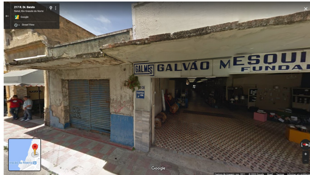
IMAGEM FRONTAL EDIFICAÇÃO RDB-213 (NOV. DE 2011)