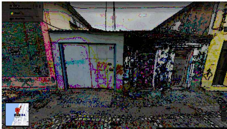
IMAGEM FRONTAL EDIFICAÇÃO RC-53 (AGO. DE 2019)