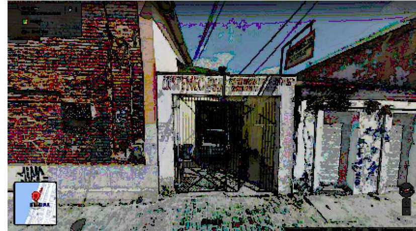
IMAGEM FRONTAL EDIFICAÇÃO RC-53 (DEZ. DE 2014)