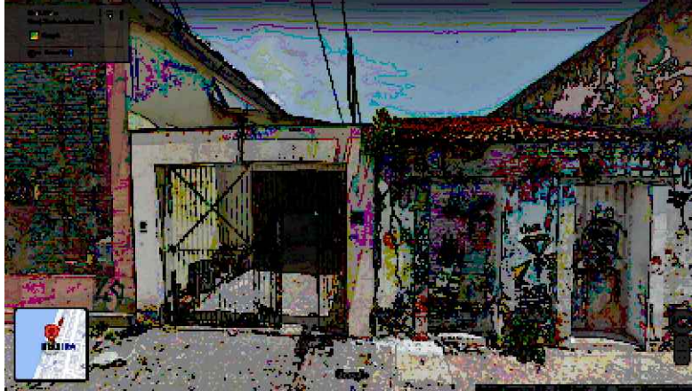
IMAGEM FRONTAL EDIFICAÇÃO RC-53 (NOV. DE 2011)