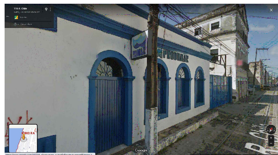
IMAGEM FRONTAL EDIFICAÇÃO RC-116 (DEZ. DE 2014)